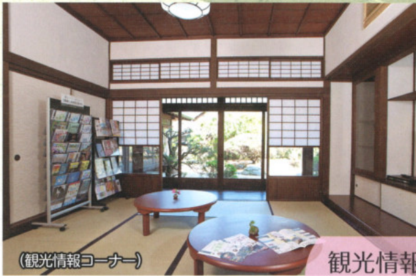
(観光情報コーナー)

佐伯城のあった城山、佐伯藩などの資料を展示した歴史資料館、明治の文豪・国木田独歩ゆかりの国木田独歩館などの歴史的な風情を楽しみつつ、観光交流館でひと休み。ゆったりとした時間をお過ごしください。