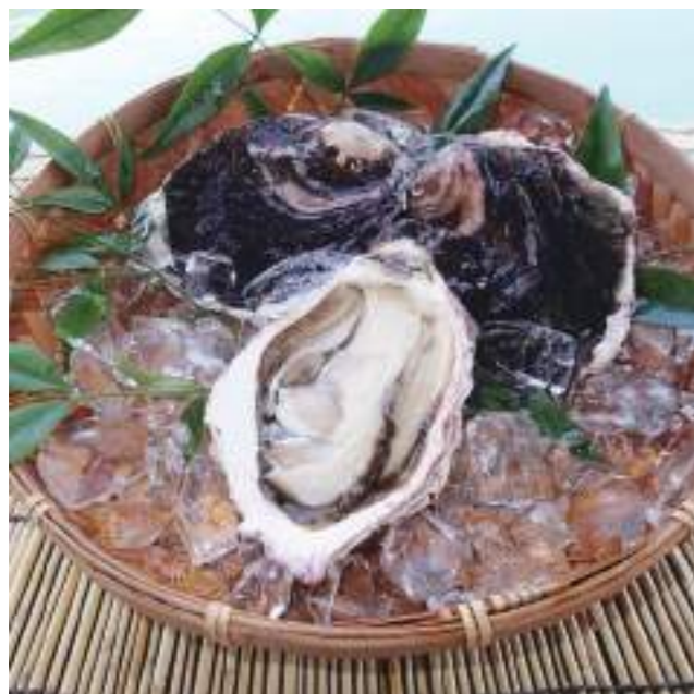
ミルクィな味わい岩牡蠣

大分県の最南端に日本の白砂青松百選に選ばれた美しい砂浜が広がる波当津海岸を有する佐伯市蒲江があります。この地域を中心として岩牡蠣養殖や販路の拡大を目的として2011年に佐伯市岩牡蠣養殖協議会が設立され現在では、蒲江や大入島などでも牡蠣の養殖が盛んにおこなわれるようになってきました。”佐伯の殿様浦で持つ”と言われるほど、佐伯の海は清流番匠川から流れるきれいな山水によって、昔から良質な海洋資源が採れる漁場として栄えてきました。岩牡蠣もプランクトンが豊富な佐伯の海で育ち、身が大きく旨みも濃いと評判になっています。当協議会では、佐伯産の岩牡蠣を手軽に味わえるようにと、佐伯岩牡蠣ガーリックバター醤油と、佐伯岩牡蠣かぼすバターのレトルト商品を開発し、県内のデパートや空港で販売をおこなっています。