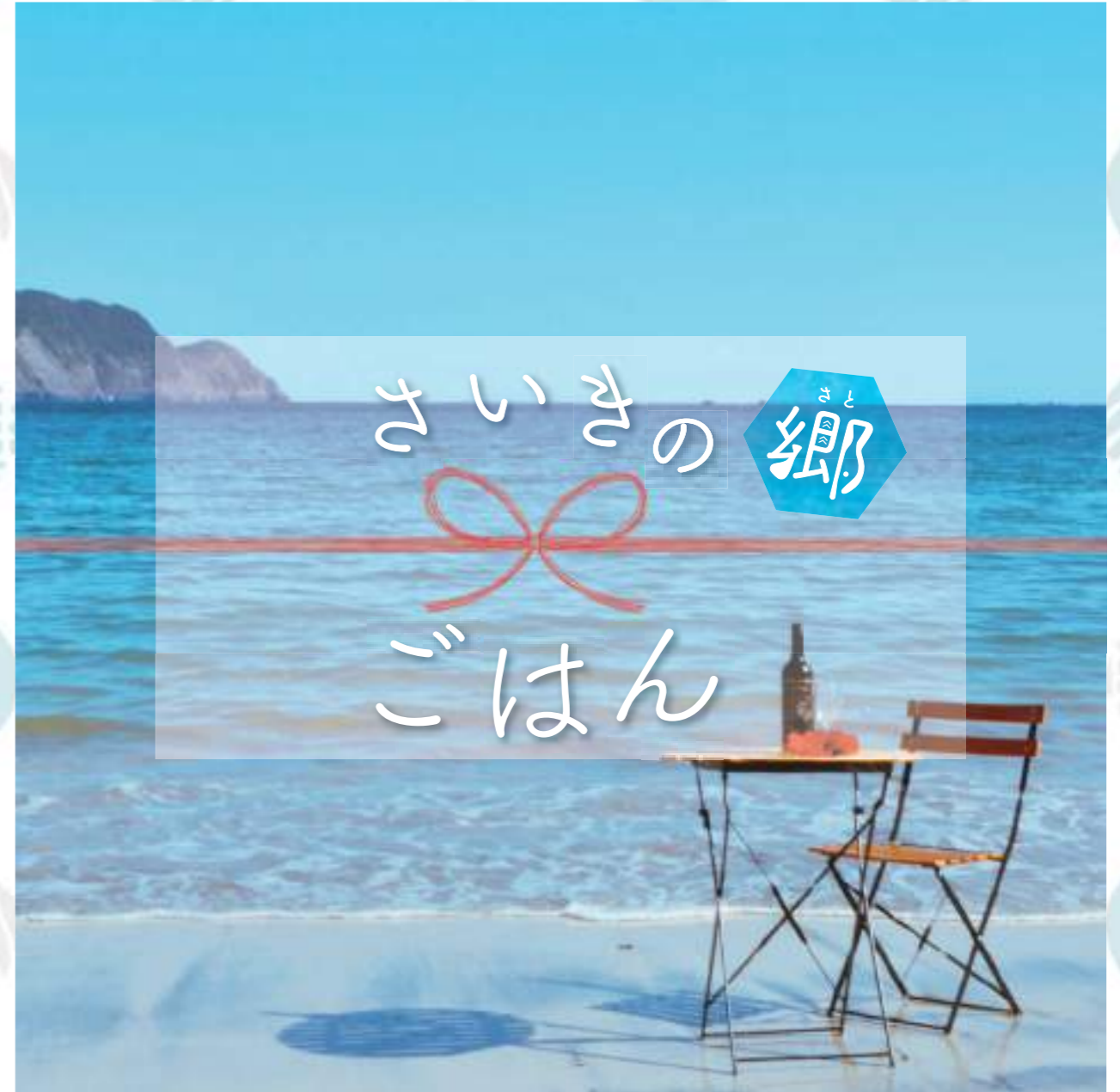
佐伯市蒲江 波当津海岸