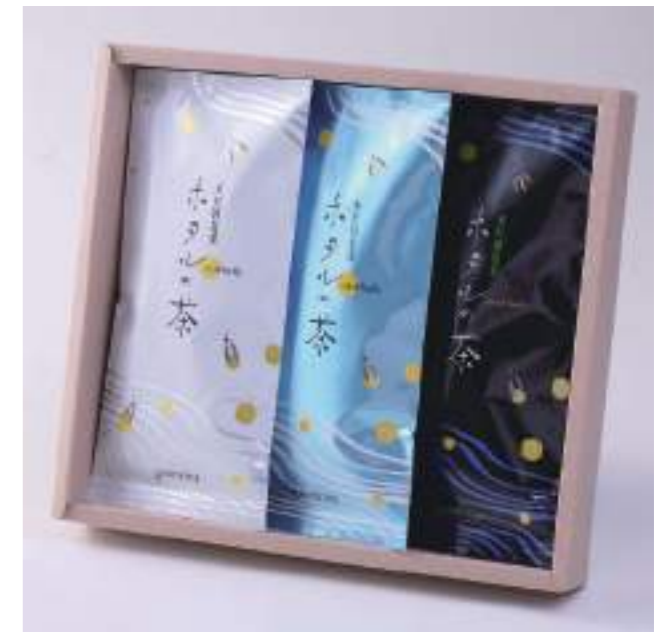
釜炒りの香ばしさを漂う、黄金色の茶葉