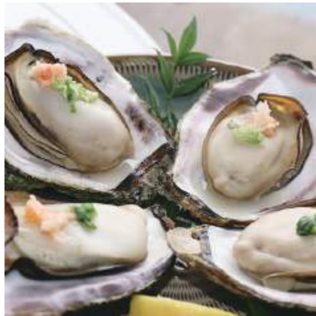
濃厚ぷりぷり岩牡蠣