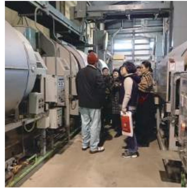
工場見学に訪れた外国の方々

佐伯市を流れる番匠川の源流を有する旧本匠村地域に国産ウーロン茶作りに挑戦する有限会社「きらり」があります。この地は、春には2500本余りの桜が咲く岩屋地区や夏には百万匹以上のホタルが飛翔する清流番匠川、秋には紅葉と岩肌のコントラストが素晴らしい小半地区など四季を通して楽しめる素晴らしい原風景が残る地域です。この旧本匠村地域では明治時代より日本茶作りが盛んにおこなわれ“困尾茶（いんびちゃ）”として生産されてきました。困尾茶は摘んだ葉が発酵しないように直火の釜で炒る“釜炒り製法”で生産され、佐伯市をはじめ九州の限られた地域にしか残っていない製法となり、生産量は日本茶全体の1%未満とも言われている貴重なお茶となっています。