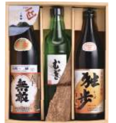
● 内容 / 本格焼酎「天下無敵」25 度 (900ml) 本格焼酎「豊後むぎ」20 度 (720ml) 本格焼酎「独歩」20 度 (900ml)