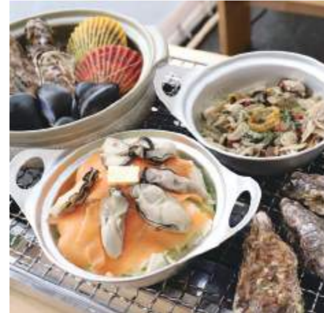
(左上から) ワイン蒸し・アヒージョ・ちゃんちゃん焼き