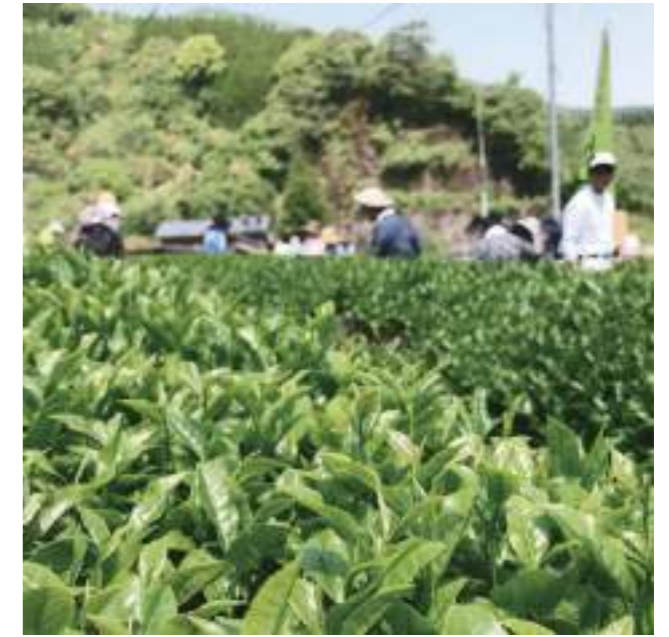
良質な茶葉が育つ山あいの里

本来、ウーロン茶は茶葉を一度発酵させたのち釜炒り製法の工程を経て作られたことから、きらりでは困尾茶の生産工程を活かして本匠ウーロン茶の商品化を開始しました。ウーロン茶づくりでは先進地である宮崎県まで勉強のため通い、茶葉の種類、発酵工程など約1年をかけ試行錯誤の末“本匠ウーロン茶”として出せるものにやっと辿りつく事ができました。試飲会では、香りの良さや味についてよい印象をもった方々が多く、本場中国の高級ウーロン茶にも引けをとらないと評価する方もいたほど仕上がりは上々となりました。本匠ウーロン茶づくりは、まだまだ始まったばかりではありますが、そこにはこれまで困尾茶作りで培ってきたノウハウ、プライドを感じる商品になっています。