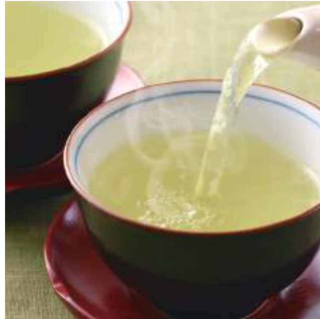
釜炒り製法で作られる困尾茶