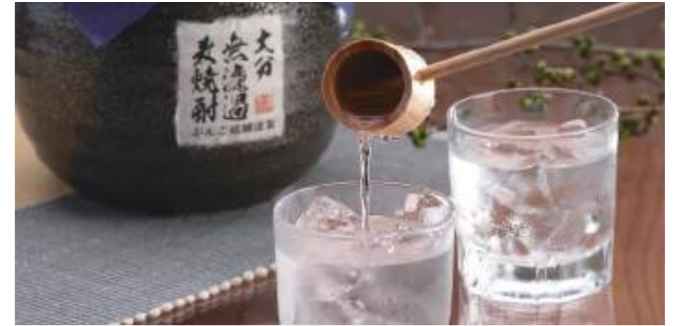
● 内容 / ぶんご太郎 (麦焼酎) 20 度 (900ml)