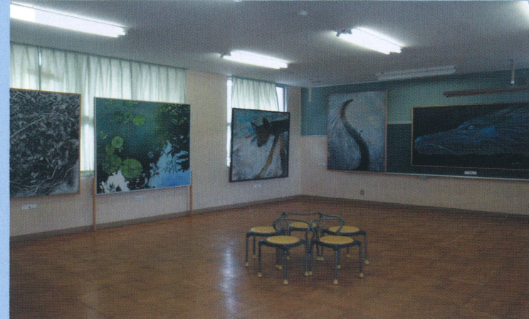
2F 100号以上の展示室 2