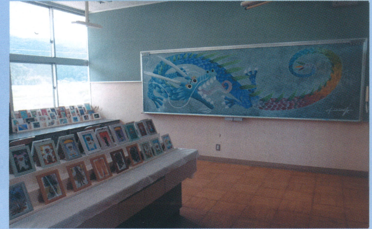
2F はがきサイズのレプリカの展示室