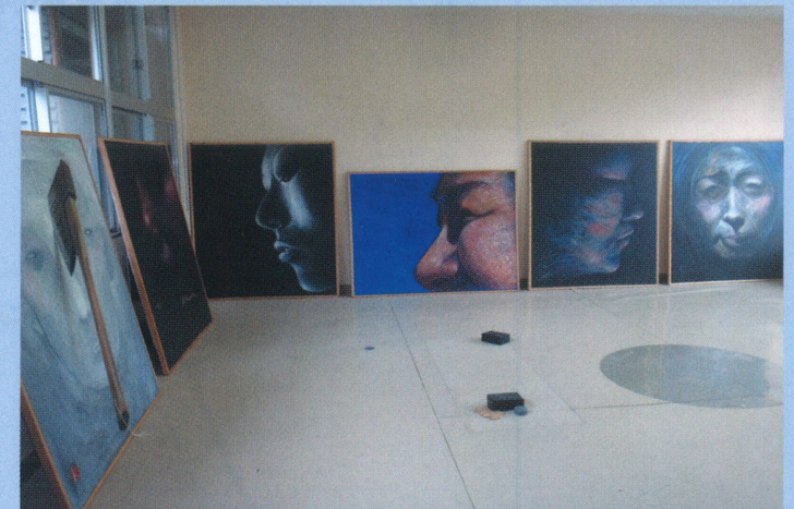
1F 100号以上の「顔」の展示室