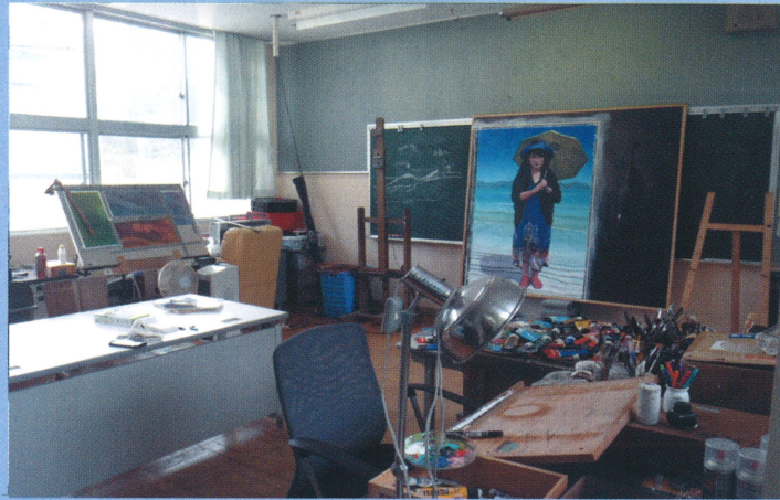
1F 製作室 (アトリエ)