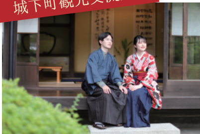
レトロな雰囲気がかステキ♪