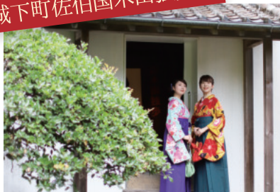
昔、文豪が住んでいたそう。 文豪の気持ちになれるかな？