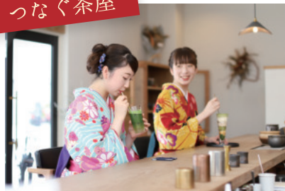
おしゃれなカフェでパチリ！