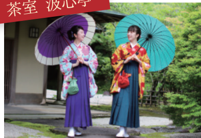
緑に囲まれたお茶室で 一服いかが？